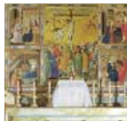
Kaplica Przenajświętszego Sakramentu.

Dnia 31 grudnia 1959 roku Święty Josemaría odprawił pierwszą Mszę Świętą w Kościele Najświętszej Maryi Panny Królowej Pokoju. Kościół ten, od chwili erekcji Opus Dei jako Prałatury Personalnej stał się Kościołem Prałackim. Nabożeństwo Św. Escrivy do Najświętszej Maryi Panny sprawiło, że kościół jest pod takim właśnie wezwaniem, a w głównym ołtarzu widnieje wizerunek Najświętszej Maryi