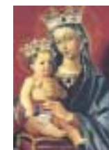
Najświętsza Panna Maryja Królowa Pokoju. Ołtarz.

“Najświętsza Maryja Panna jest Królową Pokoju. Dlatego, kiedy nastaje niepokój w twej duszy, w środowisku rodzinnym lub zawodowym, w życiu społecznym lub międzynarodowym, nie przestawaj Jej wzywać: Regina pacis, ora pro nobis! – Królowo Pokoju, módl się za nami! Czy próbowałeś tego, wówczas gdy jesteś pełen wewnętrznego niepokoju? Zadziwi cię natychmiastowa skuteczność tej modlitwy.”