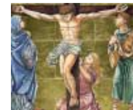
Droga Krzyżowa, stacja XII: Chrystus na Krzyżu. Ceramika.

Panny Królowej Pokoju. W krypcie kościoła znajduje się Kaplica Przenajświętszego Sakramentu oraz konfesjonały. Święty Josemaría nieustannie mówił o konieczności częstego przystępowania do Sakramentu Pokuty i Eucharystii, darów Boga dla swoich dzieci, źródła pokoju i nieprzemijającej radości.