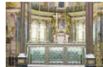
Ołtarz, w którym spoczywają doczesne szczątki Św. Josemarí.